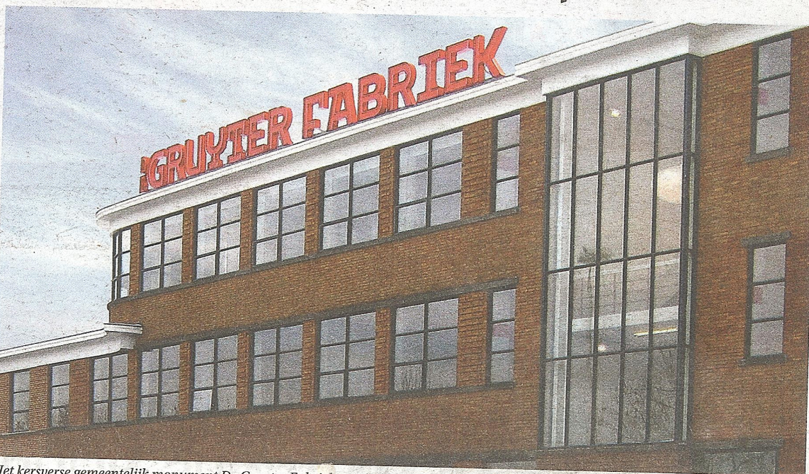
Het kersverse gemeentelijk monument De Gruyter Fabriek speelt een belangrijke rol tijdens de Open Monumentendagen in 's-Hertogenbosch

REGIO - Altijd al eens een kijkje willen nemen in die oude fabriek, die monumentale boerderij of dat bijzondere stadspand? Op zaterdag 10 en zondag 11 september heeft u er weer de kans voor. Dan wordt voor de 25ste keer de jaarlijkse Open Monumentendag gehouden. Dit jaar is het thema: Nieuw gebruik - Oud gebouw. In de regio zijn voor deze speciale jubileumeditie meer dan zeventig monumenten gratis toegankelijk voor bezoekers.